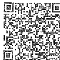
График и номера каналов

Приносим извинения за доставленные неудобства.