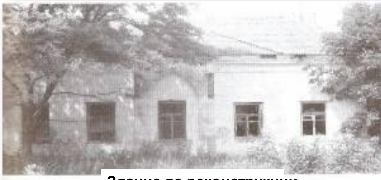
Здание до реконструкции

В 30-40-я годы XIX ст. на Беларуси начали строить дороги нового типа - шоссейные. В 1843 и 1846 гг. В России разрабатывались "образцовые" проекты станционных соглашений, которые строили около шоссейных дорог. На бывшем большаке Москва - Варшава около д. Соколовка сохранился такой дом. Это одноэтажное строение под высокой двускатной крышей.